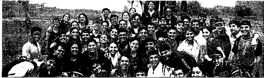
Influencing Practice & Promoting Value Based Growth